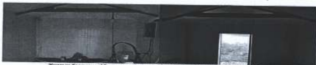
Хуульч барилгын 10 хөдөөр хана, хөндөг дундтай, хөндөг барилгын барилга.