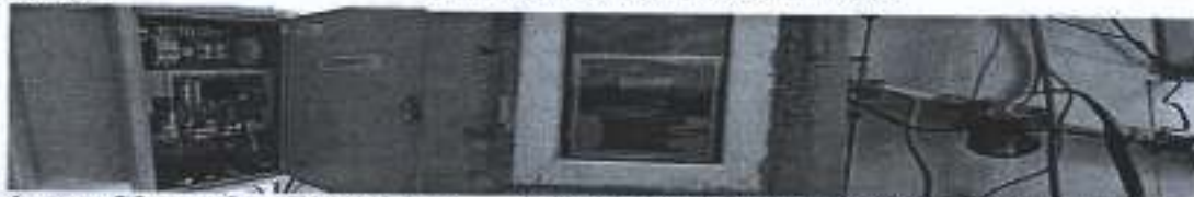
Автохуудар 3.0 сервер болон Terminal цэвэрлэгч (NPC RFID уншигчтай, LCD дэлгэцтэй) Цахилгаан хөдөлгөөн

Дундговь аймгийн Сайхан-Овоо сумын төвийн Ундны утмы зөгийг уурхайн хүчлэгт өмөрт тохиоромж сууринлуулах төслийн хүрээнд сууринлуулагдсан тохиоромжийн зураг