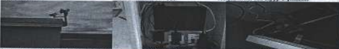
Хамгааллын өмсөр гадна, Гадна гэрэлтүүлэг