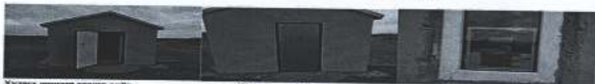
Хуульч барилгын барилга хана,